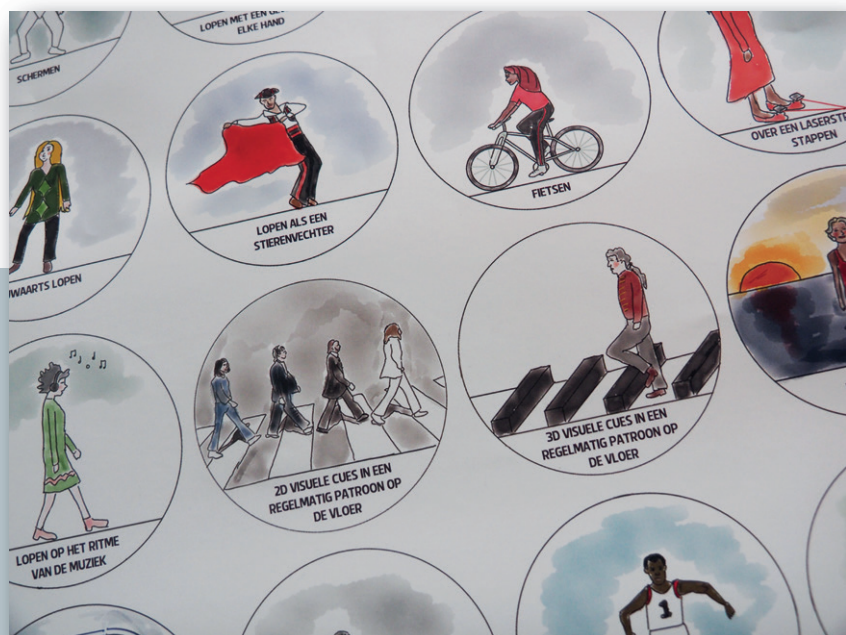
Uitsnede uit de poster met omweggetjes bij fysieke freezing